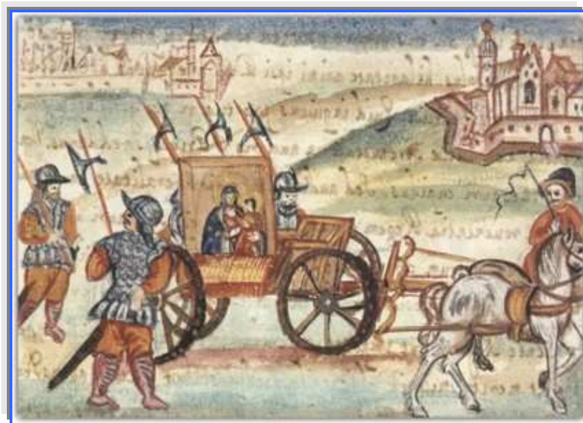
Przewiezienie obrazu Matki Bożej

1382.08.09 Przy dawnym kościele parafialnym pod wezwaniem Najświętszej Marii Panny został ufundowany klasztor ojców paulinów sprowadzonych tu z Węgier. Parafia ta została przeniesiona wówczas do kościoła filialnego pod wezwaniem św. Zygmunta w Częstochowie. Władysław Opolczyk hojnie uposażył klasztor. Jego nadania obejmowały między innymi: dwie wsie Starą Częstochowę (Częstochówkę) i Krowdrzę (dzisiejszą Kawodrzę) oraz hutę żelaza z sadzawką i folwarkiem, które były położone w pobliżu klasztoru.