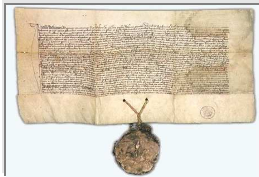
Dokument erekcyjny z 1382 roku wydany przez księcia Wł.

1382.08.09 Przy dawnym kościele parafialnym pod wezwaniem Najświętszej Marii Panny został ufundowany klasztor ojców paulinów sprowadzonych tu z Węgier. Parafia ta została przeniesiona wówczas do kościoła filialnego pod wezwaniem św. Zygmunta w Częstochowie. Władysław Opolczyk hojnie uposażył klasztor. Jego nadania obejmowały między innymi: dwie wsie Starą Częstochowę (Częstochówkę) i Krowdrzę (dzisiejszą Kawodrzę) oraz hutę żelaza z sadzawką i folwarkiem, które były położone w pobliżu klasztoru.